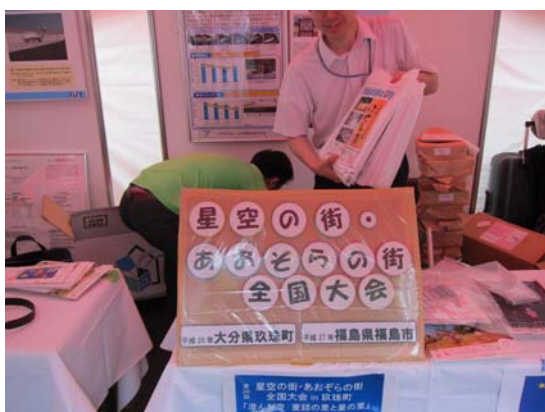
大気生活環境室の「におい・星空コーナー」