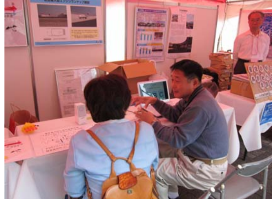
騒音についてミニ相談会