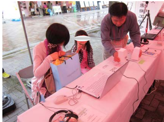
子供にも人気の体感コーナー