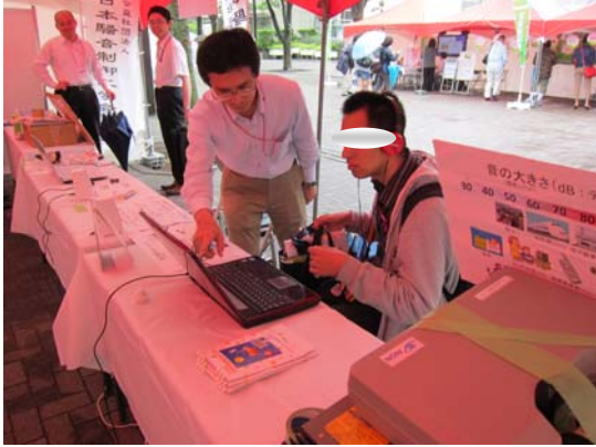
熱心に音を聞くお客様