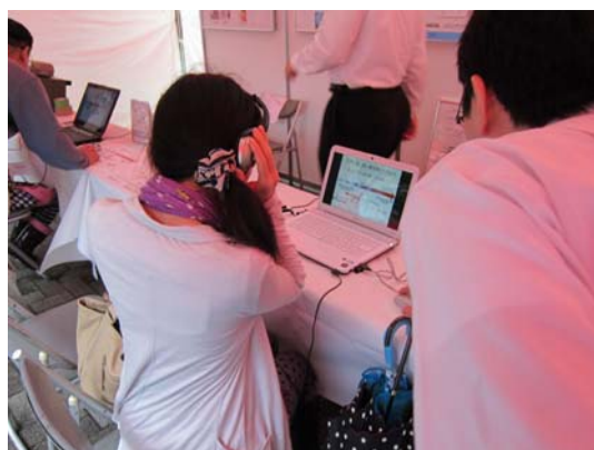
音の高低を体感されるお客様