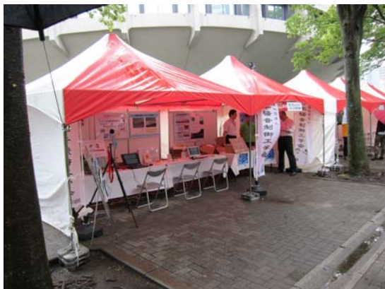
外から見たブースの状況（のぼり旗を新調）

当日は、あいにくの雨天でしたが、2日目午後からは天気も回復し、大声コンテストには沢山のお客様に参加して頂きました。