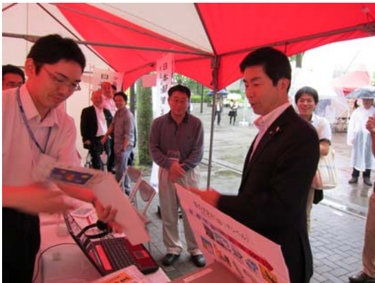
ご視察された牧原環境大臣政務官